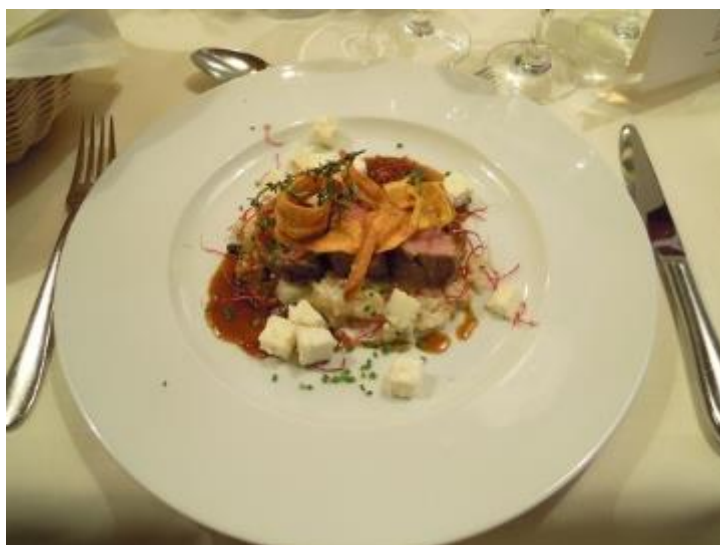
Lammrücken auf Spargelrisotto mit Fetakäse und Rucola