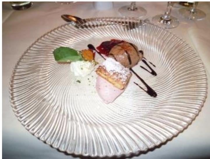
Erdbeer-Mascarponecreme mit Blätterteigpolster und Schoko-Chilimousse

Herzlichen Dank nochmals an das K+K – Team für dieses wunderbare Dinner.