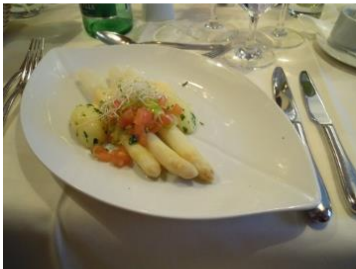
Marchfelder Spargel mit Sauce Bernaise und heurigen Erdäpfeln

Matjes- und Lachstartar auf Apfelscheiben mit Dillsenfsauce