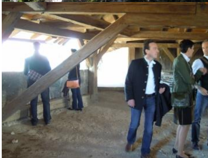
Die Aussicht war an diesem schönen sonnigen Tag gigantisch.